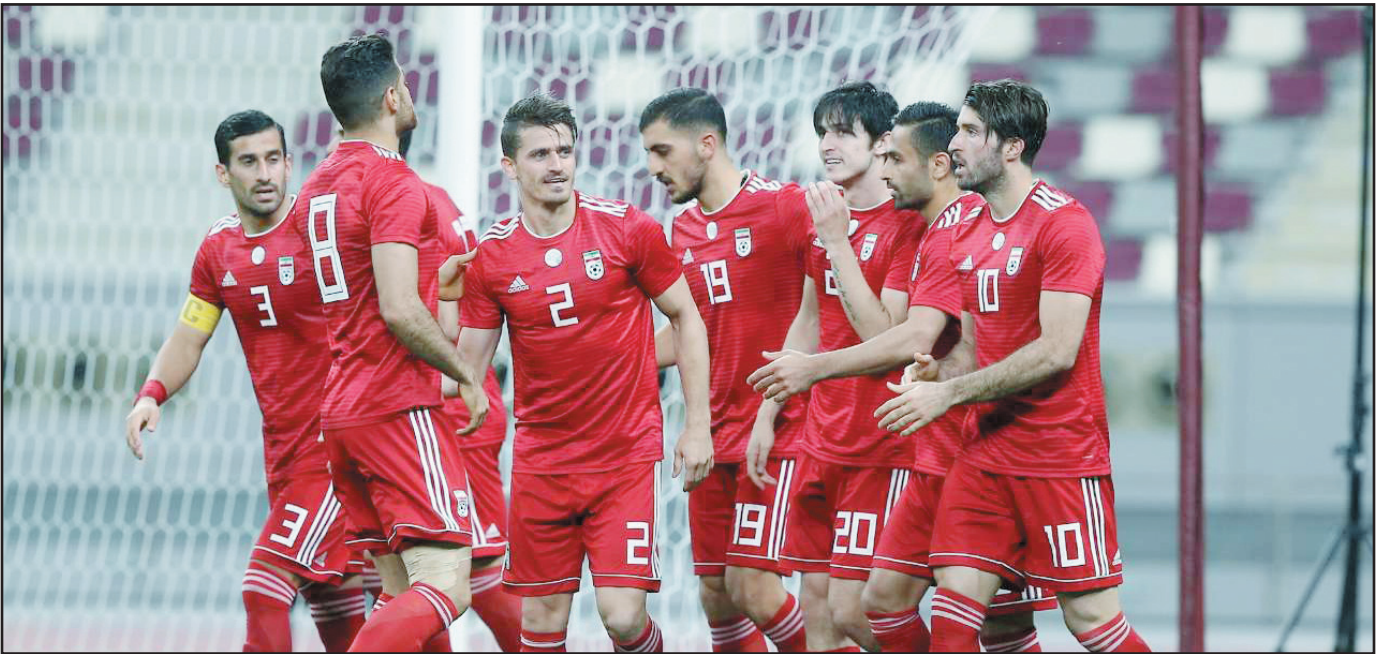
تصویر اصلی از این

بسته شدن پرونده بازی‌های تدارکاتی ایران برای جام ملت‌ها با ۴ برد، ۲ مساوی و بدون باخت