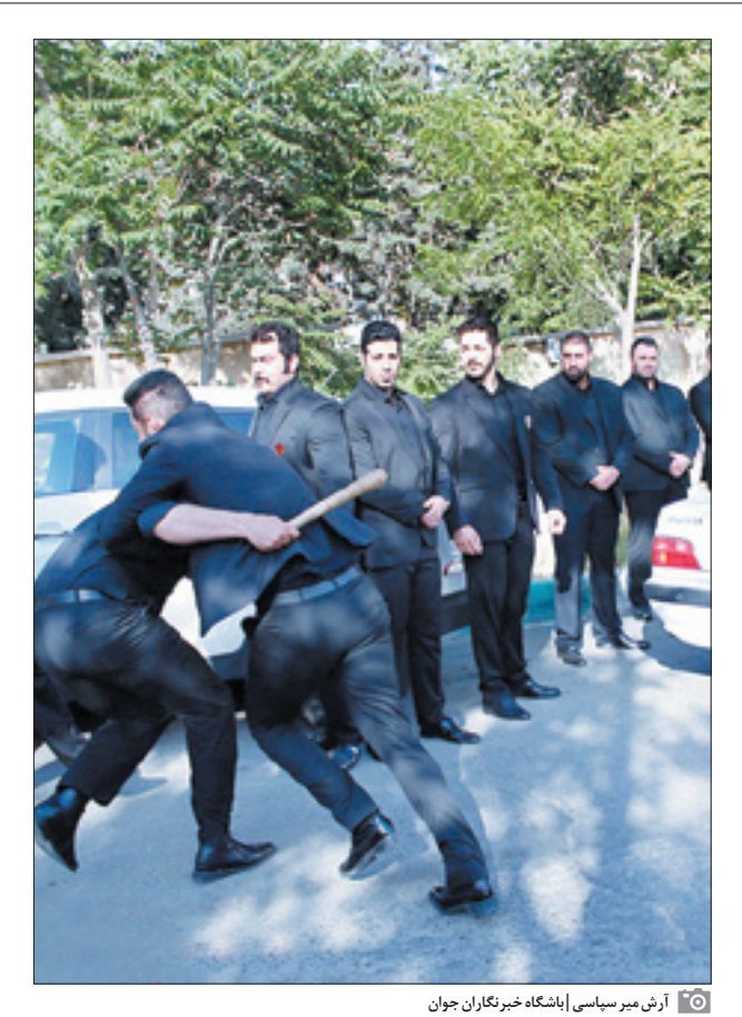
آرش میرسیاسی|باشگاه خبرنگاران جوان

پلیس: ارائه خدمات حفاظت شخصی غیرقانونی است