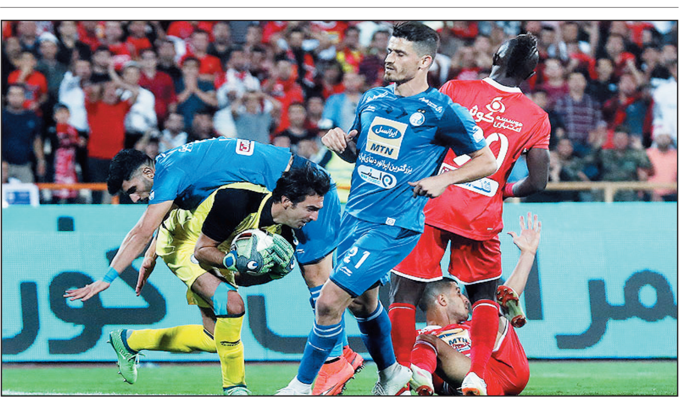
مصدوم بازیکنان فوتبال