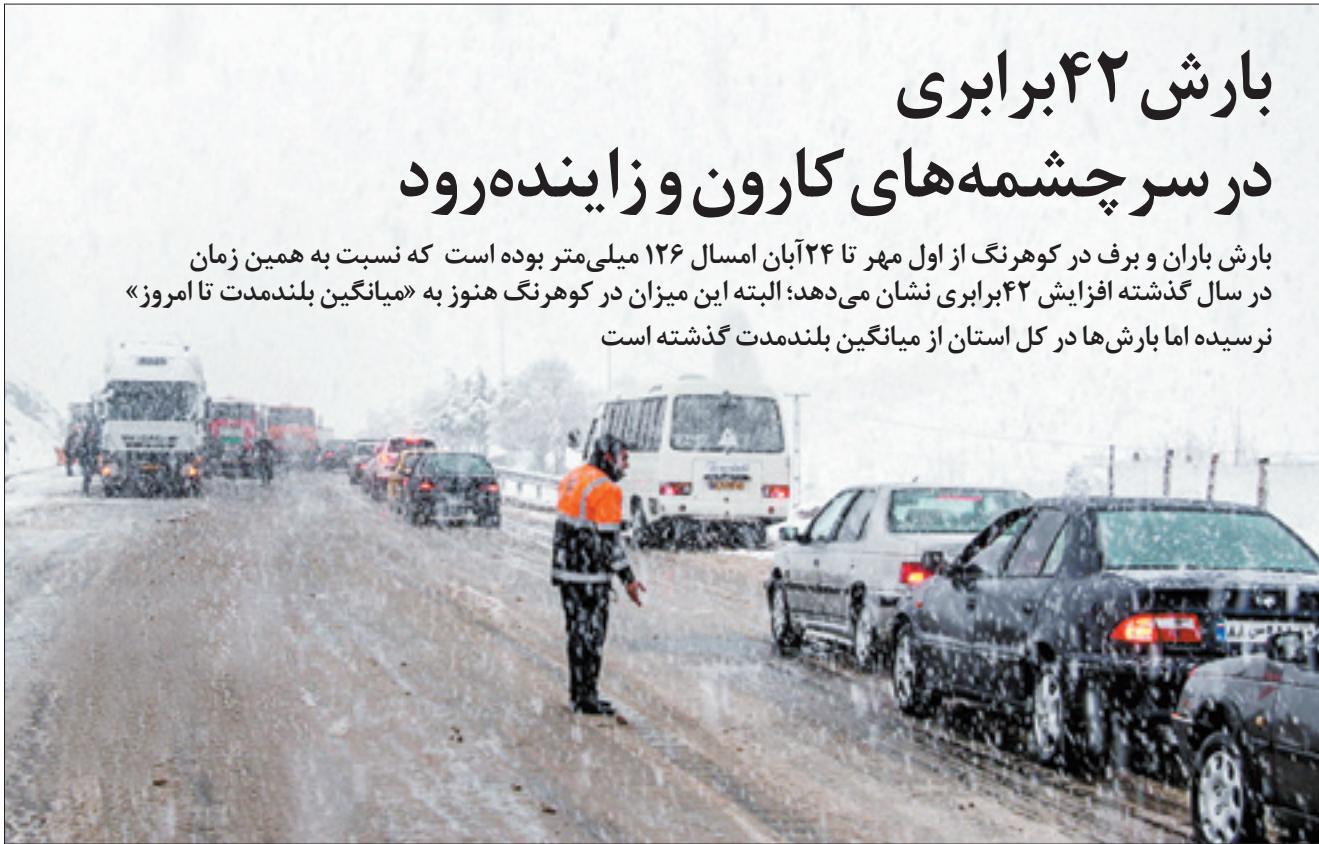
فرشیداردلان ایسنا | همین صفحه

وی در ادامه افزود: به نظرم قهرمانی ایران دور از انتظار نبود اما اعتراف می‌کنم که اگر هوای بارانی نبود با توجه به پتانسیل که بازیکنان داشتند می‌توانستیم قهرمان شویم. البته می‌دانم که این به نوعی بهانه است و گرنه همه در یک شرایط آب و هوایی تیر انداختند اما چون بچه‌ها ما کمتر در این شرایط بارانی تیر انداخته بودند باعث شد در نهایت این مقام را کسب کنیم. سرمربی تیم تیرو کمان روسیه با اشاره به اینکه در کامیوند بانوان نتایج خوبی گرفتیم، اظهار داشت: بر عکس تیم