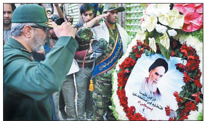
رئیس سازمان بسیج در مراسم تجدید میثاق بسیجیان با آرمان‌های امام خمینی (ره):

روزنامه سیاسی، اجتماعی و فرهنگی صبح ایران چهارشنبه ۳۰ آبان ۱۳۹۷ - ۱۳ ربيع الاول ۱۴۴۰ سال بیستم - شماره ۵۵۲۱ - ۱۶ صفحه قیمت: ۵۰۰ تومان